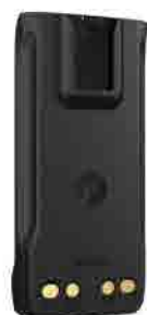
PMNN4807 PMNN4809 PMNN4810