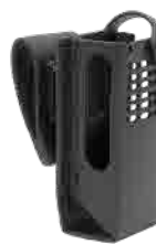
PMLN8303 PMLN8302 PMLN8304