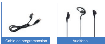
Cable de programación