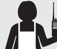
PERSONAL DE COCINA/BARRA

Manténgase informado sobre cualquier asunto que requiera atención antes de que se vuelva un problema