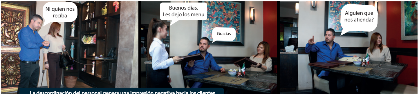
La desordinación del personal genera una impresión negativa hacia los clientes.