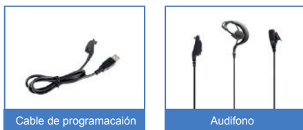
Cable de programación