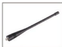
Antena de látigo