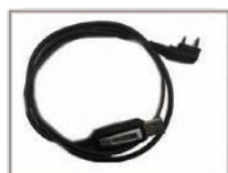
Cable de programación