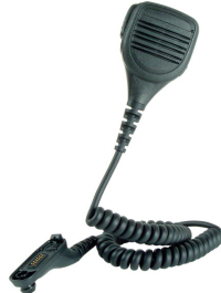
PMMN4024 PMMN4025 PMMN4040