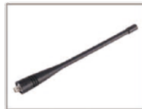
Antena de látigo