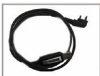
Cable de programación