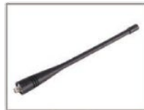
Antena de látigo