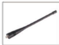
Antena de látigo